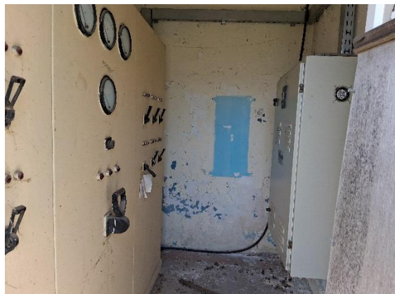
ΛΕΣΧΗ ΟΠΛΙΤΩΝ-ΥΠΑΞΚΩΝ (No 10)