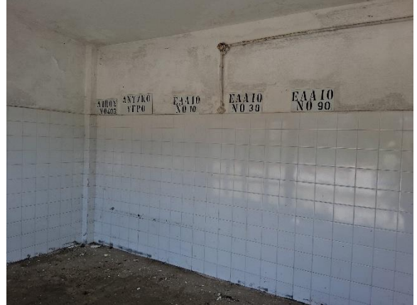
ΚΤΙΡΙΟ ΔΙΟΙΚΗΣΕΩΣ (No 7)